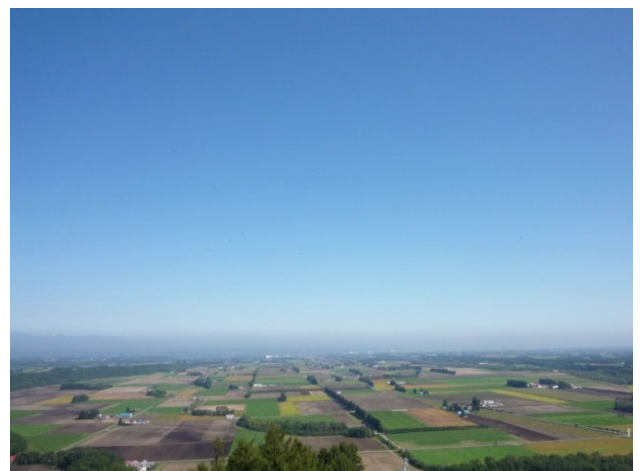
(十勝平野・とちち晴れ)